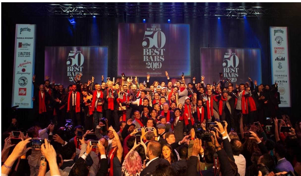
WORLD'S 50 BEST BARS セレモニー

WORLD'S 50 BEST BARS は世界最大のカクテルの祭典 London Cocktail Week（2019年10月4日～13日）と合わせてロンドンにて行われるカクテルアワード。WORLD'S 50 BEST RESTAURANTS のバー版としてスタートし今年で10年目を迎えた。期間中はロンドンを中心にヨーロッパ各地のトップクラスバーに世界中からバーテンダーがゲストシフトとして招かれ、会場には40以上のポップアップバーがオープン。飲料業界従事者や世界中からカクテルファンが集まる。