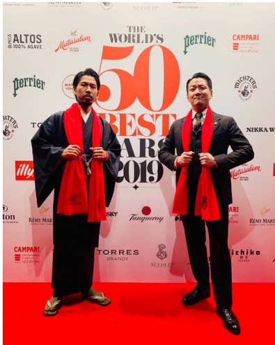
The SG Club