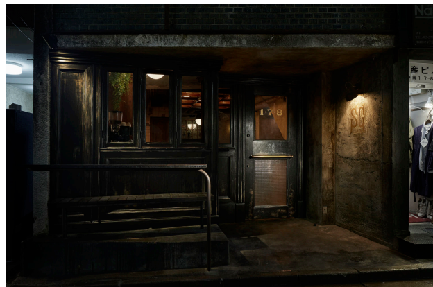
左上：1F「Guzzle」 右上：地下1F「Sip」 左下：2F「Savor」 右下：The SG Club 外観